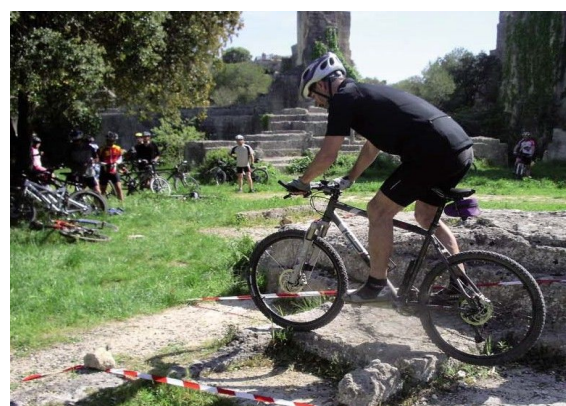
Rappel réglementation et esprit rando

13h : Sortie pour mise en application des exercices, puis retour 16h : débrief, fin 17h